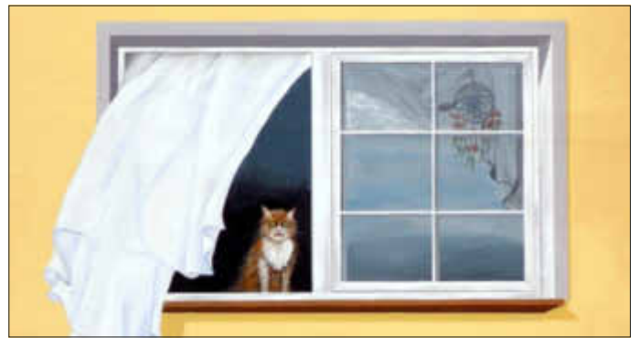
Lesen Sie auf Seite 2 weiter