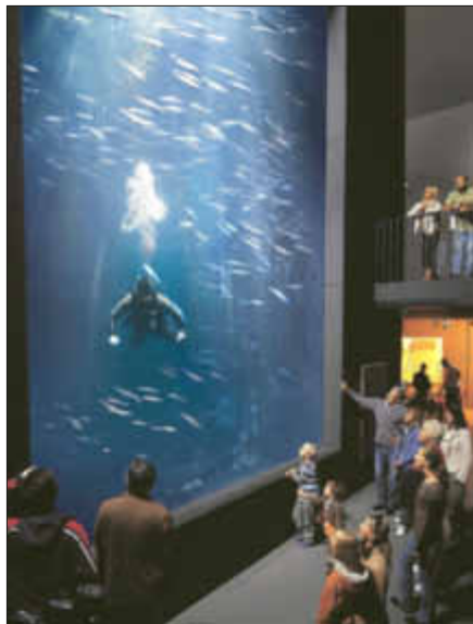
Energiesparen, aber wie? Dieser Frage stellt sich unter anderem die Müritzeum gGmbH.

Mit zwei weiteren Sitzungen am 13.6. und 25.7. hat der Klimarat der Stadt Waren (Müritz) seine Arbeit fortgesetzt. Dabei wurde eine Energie- und CO 2 -Basisbilanz präsentiert, die im weiteren Arbeitsprozess mit detaillierteren Daten noch verbessert werden soll. Die Fachhochschule Stralsund stellte erste Untersuchungsergebnisse zur Frage vor, in welchem Umfang erneuerbare Energien in der Müritzstadt genutzt werden könnten. Zudem wurden Themenkreise gebildet, um die für den Klimaschutz zentralen Themen Energie, Verkehr und Öffentlich-