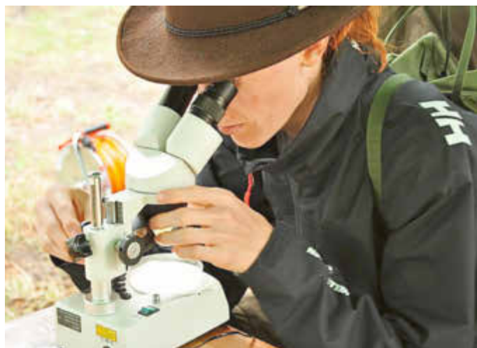
Kleines wird unter dem Mikroskop groß

Noch bis zum Freitag (23. Oktober) läuft vor und in der Nationalparkinformation in Federow die Entdeckerwoche des Müritz-Nationalparks. Wie alt wird ein Baum? Wer zersetzt Totholz? Wie viele Lebewesen tummeln sich in einer Hand voll Waldboden? All diese Fragen und noch viele mehr werden vor Ort beantwortet. Groß und Klein können an verschiedenen Stationen gemeinsam mit Rangern des Nationalparks ihre eigenen Beobachtungen machen. Zusätzlich findet um 13:00 Uhr eine kurze Entdecker-tour statt, um Proben für die Untersuchungen zu holen. Die Forscherstation ist täglich von 11:45 - 16:00 Uhr geöffnet. Anmeldung gibt's keine, aber die Zahl der Menschen in den Räumen der Info ist natürlich beschränkt. Ansonsten gelten die üblichen Hygienevorschriften. Die Entdeckerwoche ist ein Angebot im Rahmen des 30-jährigen Bestehens des Müritz-Nationalparks.