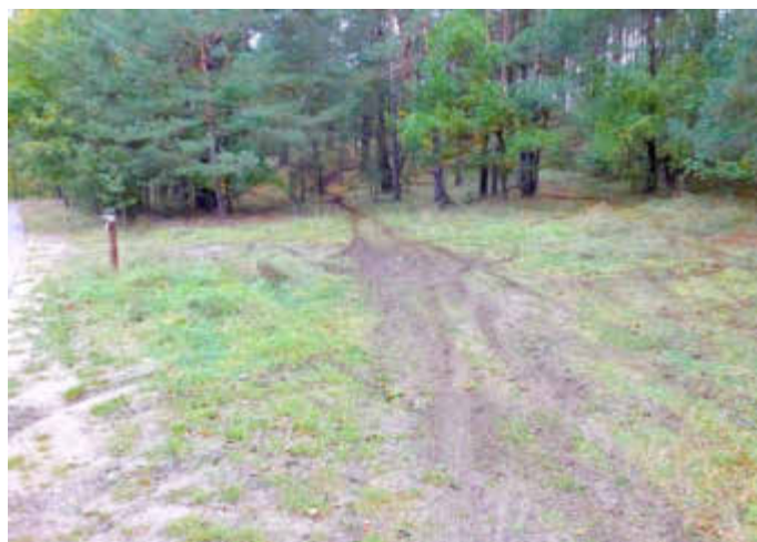
Motocrosser im Müritz-Nationalpark zerstören Waldboden

Rücksichtslose Fahrer gefährden Mensch und Natur im Müritz-Nationalpark