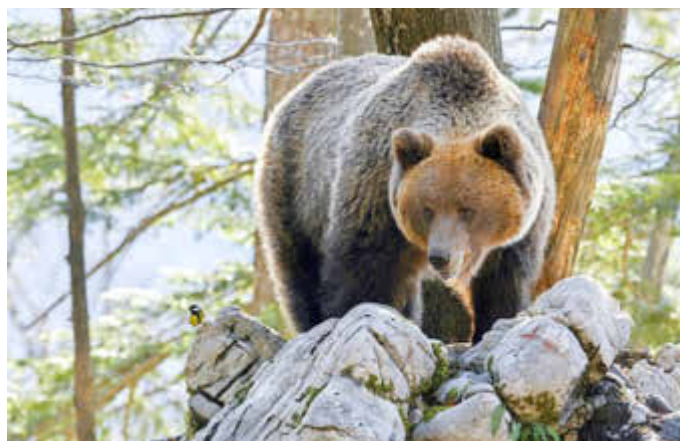
Österreich, David und Goliath