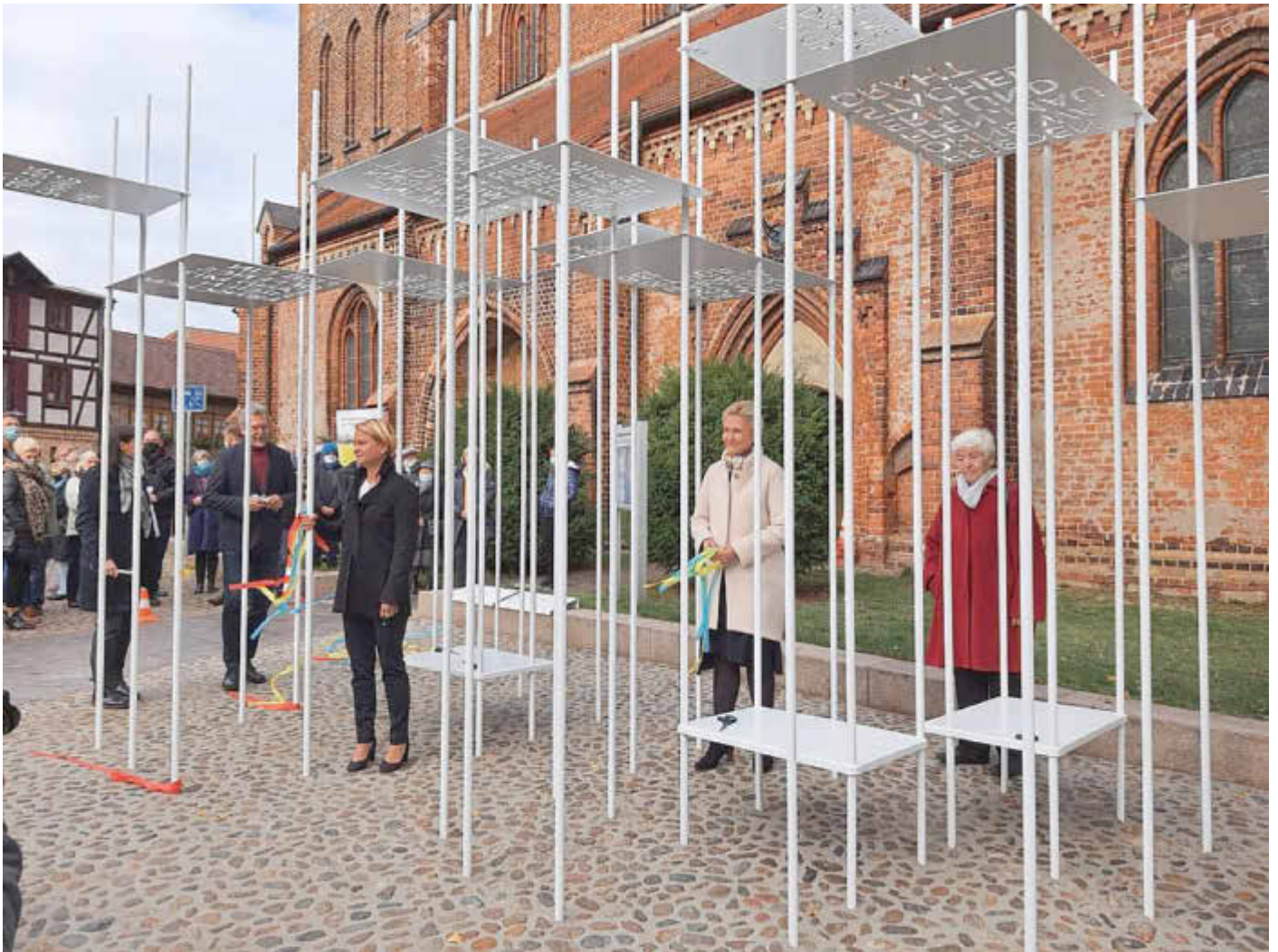
Nachdem die bunten Bänder zerschnitten waren, wurde die digitale Erweiterung des Erinnerungszeichens getestet