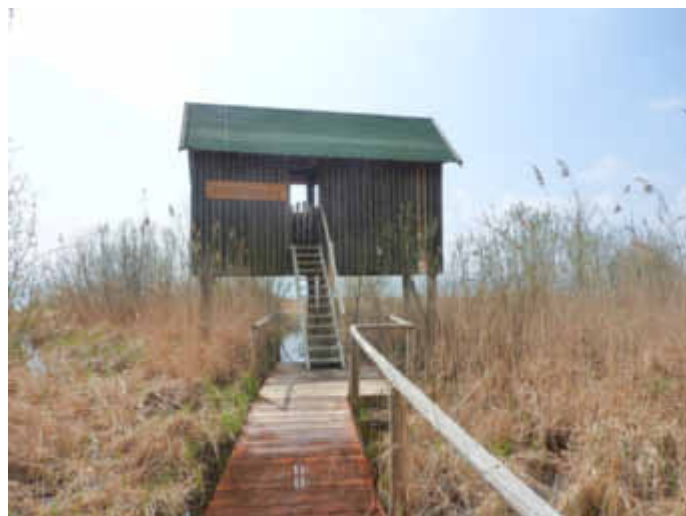
Beobachtungsstand Schnakenburg, Nationalparkamt Müritz

Beobachtungsturm an der Müritz gesperrt Ab Dienstag, den 08. Januar 2019 ist der Zugang zum Beobachtungsturm „Schnakenburg“ am Müritzufer südlich von Waren (Müritz) bis Mitte März wegen Sanierungsarbeiten gesperrt. Mitarbeiter der Werkstatt des Nationalparkamtes Müritz erneuern die Pfosten und den etwa 50 m langen Bohlensteg aus Holz, der zu dem Beobachtungsstand führt. Im Müritz-Nationalpark stehen Besuchern insgesamt 25 Aussichtstürme und Beobachtungseinrichtungen zur Verfügung, so dass die laufende Unterhaltung dieser Bauwerke immer wieder kurzzeitige Sperrungen zur Folge hat.