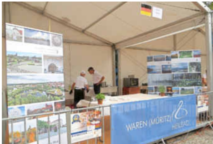
Mecklenburger Kohleintopf und Mecklenburger Sauerfleisch mit Bratkartoffeln brachten den Sieg in Suwałki