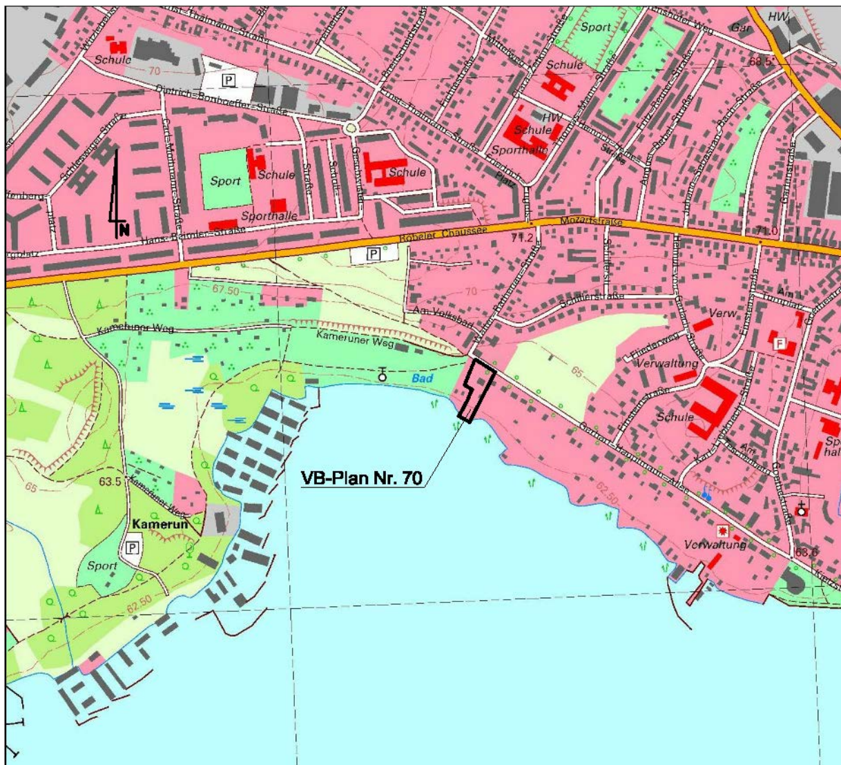
Übersichtskarte M 1:10.000