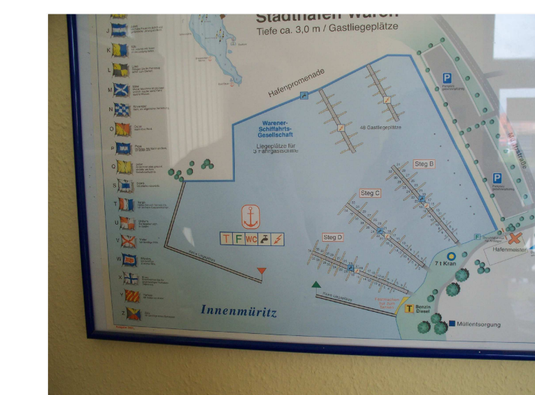
Belegungsplan der Marina (Hafenbüro)