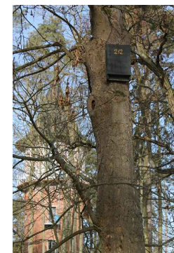
4 Typ: Spaltenkasten Koordinaten: 53.505353, 12.693359