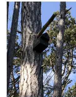
3 Typ: Spaltenkasten Koordinaten: 53.505525, 12.693068