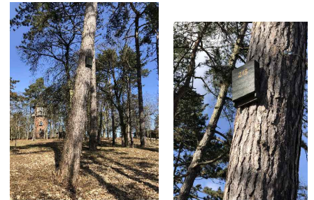
2 Typ: Universalkasten Koordinaten: 53.504247, 12.693688