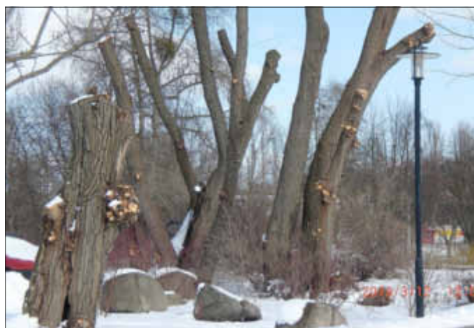
Kopfweiden am Kreisel Herrenseebrücke

Die Weidenbäume an der Straße Zur Steinmole wurden vor 8 Jahren gekappt. Dies war in diesem Fall eine Alternative zur Fällung. An der Schnittfläche bilden die so behandelten Bäume eine Vielzahl neuer Triebe aus. Im Laufe der Zeit verdickt sich der oberste Abschnitt des Stammes, es entsteht der Kopf der Weide. („Kopfweide,“) Ist eine Weide einmal zur Kopfweide geschnitten worden, muss sie regelmäßig gepflegt werden. Wenn man diese Bäume nicht zurückschneiden würde, könnte der Baum mit seiner durch große Äste veränderten Statik, unter deren Last auseinander brechen. Die geschnittenen „Ruten“ wurden in früheren Zeiten für die Korbflechterei oder in Verbindung mit Lehm als Baumaterial für Häuserwände benutzt. Ältere bzw. durchgewachsene Äste wurden für die Herstellung von Besen- und Werkzeugstielen verwendet.