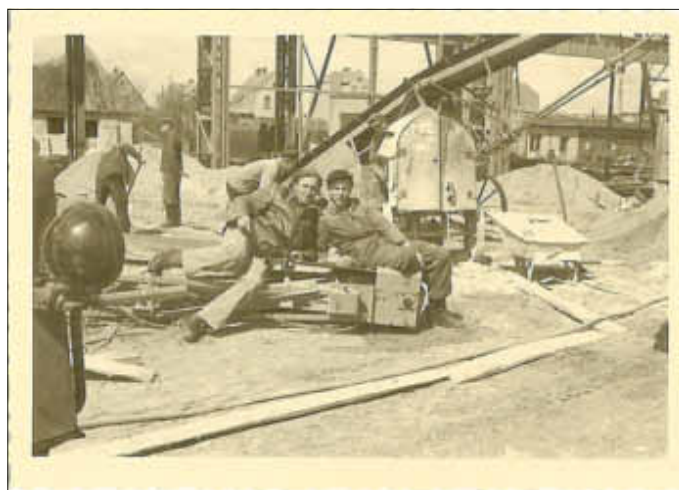
MMG - Bauphasen der Halle Süd 1954

Am Gründonnerstag, dem 28.03.2013, wird um 10 Uhr im 3. Obergeschoss des Verwaltungszentrums die zweite Ausstellung im Jubiläumsjahr eröffnet. Im Mittelpunkt stehen vier der vielen Unternehmen der Stadt Waren (Müritz) mit längerer Tradition. Im Jahre 2012 feierten die Müritz-Fischer und die Möwe ihr 60-jähriges Bestehen. Grundlagen für die heutige MMG wurden bereits vor 100 Jahren gelegt und auch unsere Müritz-Sparkasse kann auf viele Jahre zurückschauen.