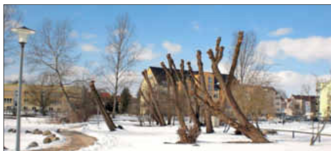
Kopfweiden am Festplatz