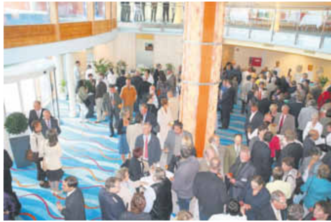
Gäste aus Politik und Wirtschaft, Vertreter der Baufirmen und Anwohner strömen in die Empfangshalle