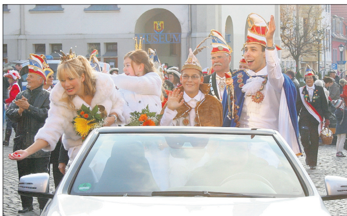
Auftakt der närrischen Saison am 11.11.2011.