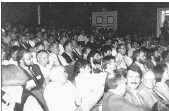
Dritte Mitgliederversammlung am 24. September 1994 in Greifswald

Am 1. Oktober 1990 hat das Gründungskomitee des Städte- und Gemeindetages die Eintragung ins Vereinsregister vorgenommen und eine erste Sitzung durchgeführt.