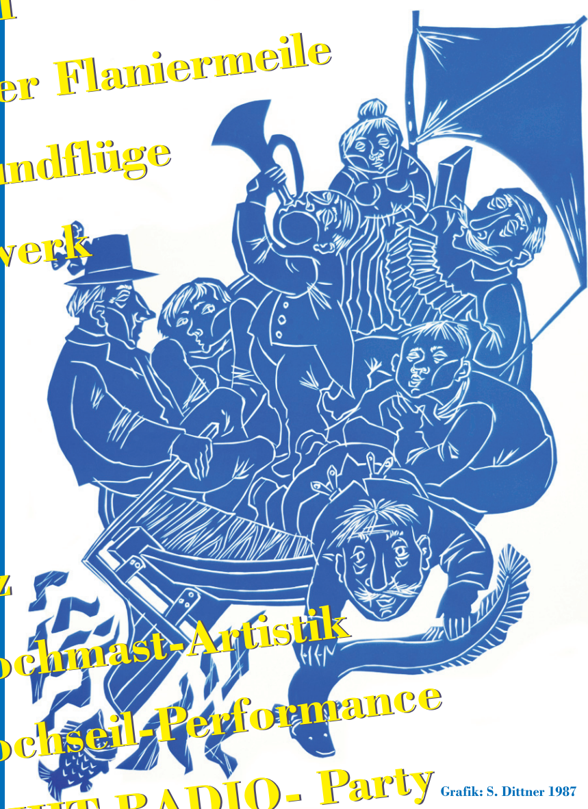
Grafik: S. Dittner 1987