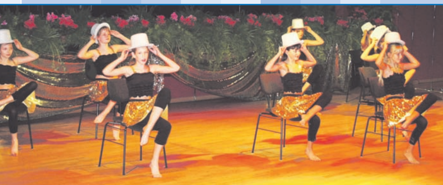
Tanzgruppe der Regionalen Schule Friedrich-Dethloff