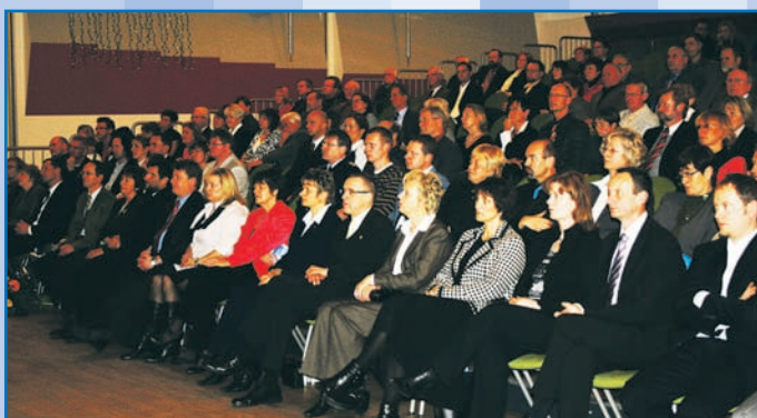
Gäste des Neujahrsempfangs