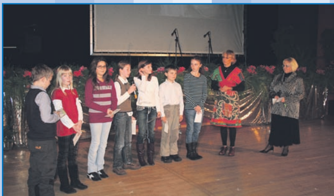
Jahreszeitenbaum der Grundschule Am Papenberg