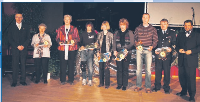
Verdienstvolle Bürger 2009