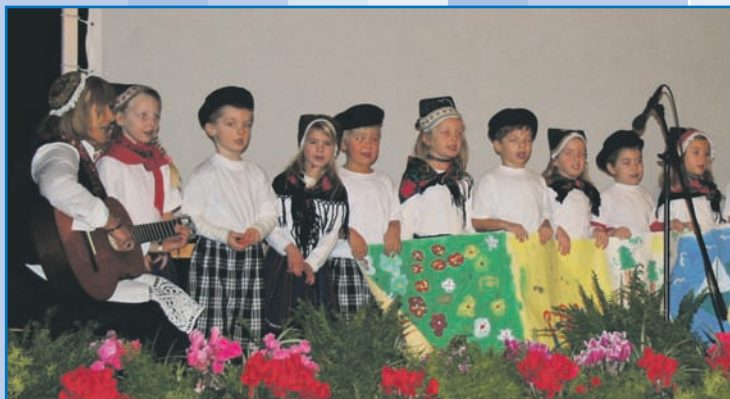
Kita Bummi präsentiert ein plattdeutsches Programm