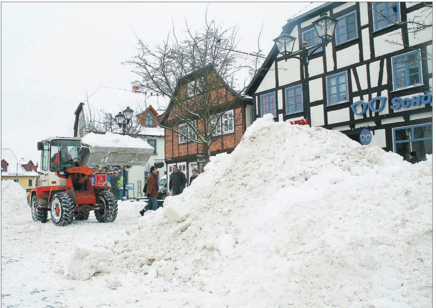
„Rodelberg“ auf dem Neuen Markt