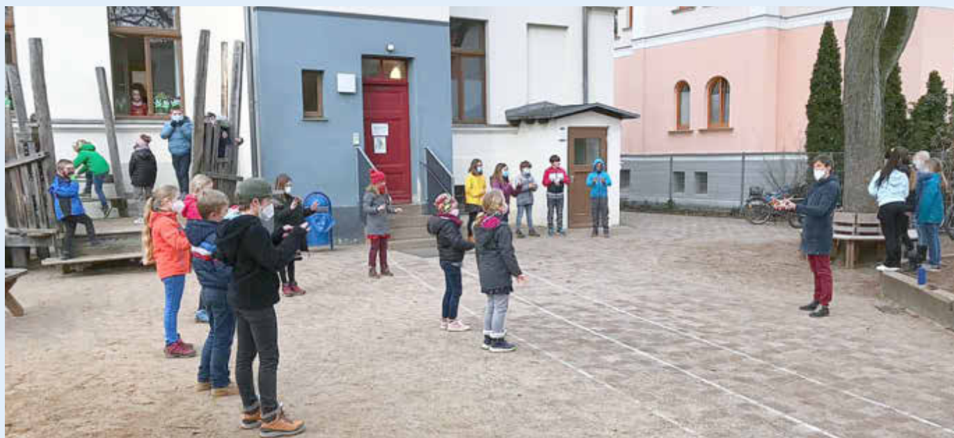
Flashmob „Singen trotz(t) Corona!“ auf dem Schulhof der Arche Schule Waren (Müritz)