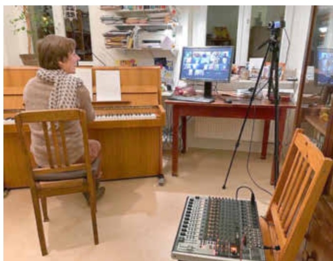
Das Kirchenmusikbüro als Online-Proben-Studio