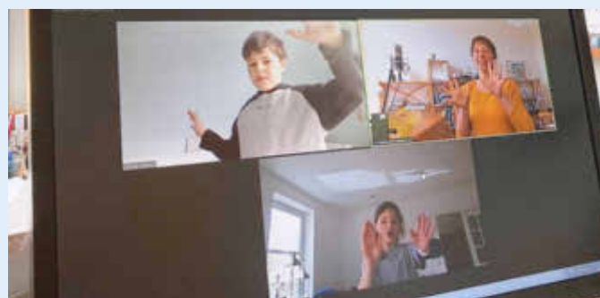
Flashmob „Singen trotz(t) Corona!“ per Zoom auf dem Bildschirm des Kirchenmusik-Büros

Nach den herrlichen Wintertagen war den Kindern die Vorstellung von Schnee, ihrem wichtigsten Winterattribut, ganz lebendig. Der Liedtext verweist aber auch auf die Bedrohung dieser Lieblings-Wintereigenschaft und will damit anregen, über den Klimawandel zu sprechen und über unsere Möglichkeiten, etwas dagegen zu tun. Im Januar lernten die Kinderchorkinder das Lied in den Online-Proben - jede und jeder vor dem eigenen Bildschirm. Die Vorstellung, dass wir über dieses Lied mit vielen anderen Kindern verbunden sind, half dabei dran zu bleiben. Wie schön das ist, dass jetzt fast