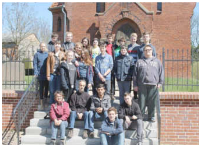
Gruppenbild von der Konfirmandenfahrt vom 20. - 24. April 2016 in Babke