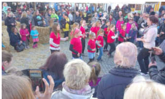
Dankeschön auch an die Kindertanzgruppe des Jugendzentrums JOO!

Über 200 Osterhasen wurden am Samstag an die Kinder verschenkt. Zuvor mussten sie natürlich suchen. Der Warener Innenstadtverein organisiert seit vielen Jahren dieses beliebte Spektakel am Osterwochenende. Das Nest maß in diesem Jahr ca. 50 qm und bot auch nach dem Suchen viel Platz zum Spielen und Toben. Und wieder kamen unzählige Warenerinnen und Warener, aber auch viele Gäste auf den Neuen Markt, um einen fröhlichen Familientag zu genießen. Strahlend blauer Himmel und Sonnenschein garantierten für gute Laune. Die Kinder belagerten die Hüpfburgen, bestaunten die lebenden Hasen, ließen sich die Gesichter bunt anmalen oder fuhren mit den kleinen Kinderkarts. Auch Ostereier konnten an einem Stand des Innenstadtvereins