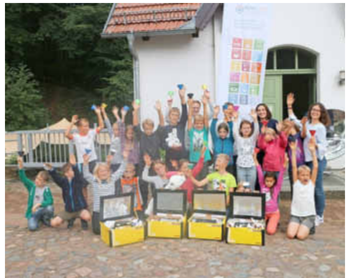
Bau der Solarbacköfen mit Schülern der Sterling-Schule aus Schleswig-Holstein