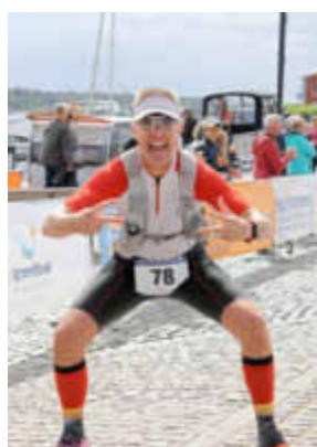
Ziel nach 75 km erreicht Ultraläufer