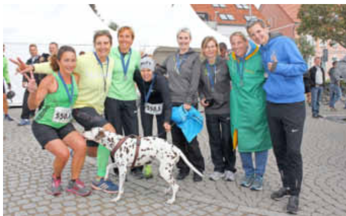
10. Sieg für die Laufbekanntschäften aus Berlin beim Staffeltwettbewerb