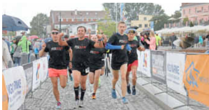
Polnische Staffel Pogodne Suwalki beim Zieleinlauf