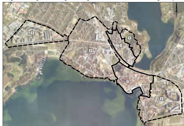
Anlage zur Satzung über den Ausgleichsbetrag für nicht herzustellende Kraftfahrzeugeinstellplätze