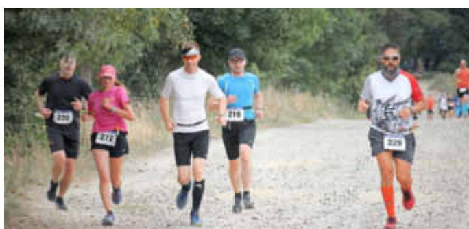
Städte-Läufer auf der Strecke