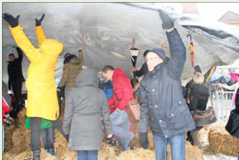
Die Kinder blieben trocken.

Durchgeführt wurden aber trotzdem das Ostereier-Bemalen, - Kochen und Färben. Die Jugendlichen bastelten mit den Kindern Martenizi oder Osterdekorationen. Dank der vielen Helfer vor Ort konnte auch das Suchen der Osterhasen stattfinden. Die riesige Plane wurde halbiert und als improvisierte Überdachung genutzt.