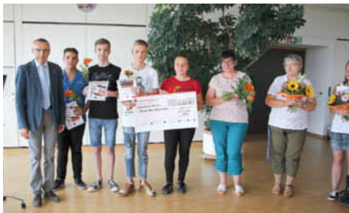
Übergabe an die Friedrich-Dethloff-Schule

Egal ob klein geschnittene Käsestückchen, Gemügesticks, verschiedene Früchte, belegte Brote und noch einiges mehr können sich Schülerinnen und Schüler der Friedrich-Dethloff-Schule sowie der Regionalen Schule Waren/West aussuchen, was sie an gesunden