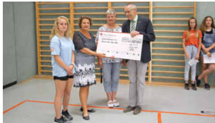
Übergabe an die Regionale Schule Waren/West