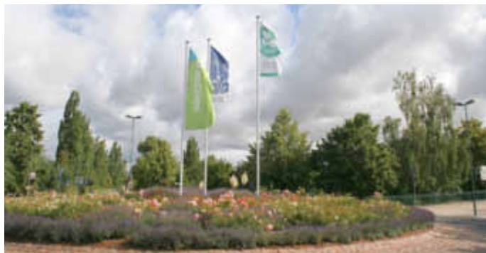
Kreisel an der Herrenseebrücke

Rund 300 Städte des weltweiten Netzwerkes „Mayors for Peace“, darunter auch Waren (Müritz), hissten am 08. Juli gemeinsam ein sichtbares Zeichen gegen Atomwaffen setzen. Vor den Rathäusern oder an anderen gut sichtbaren Plätzen wehte die Mayors for Peace Flagge.