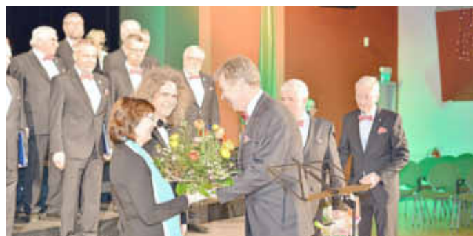
Glückwünsche an den Müritzchor