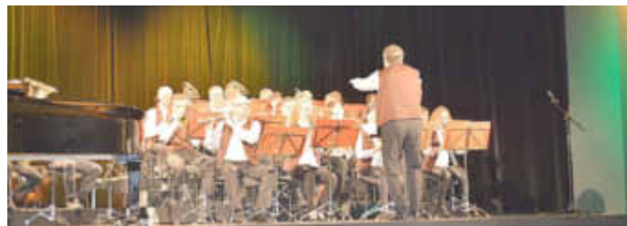
Blasorchester Waren e.V.