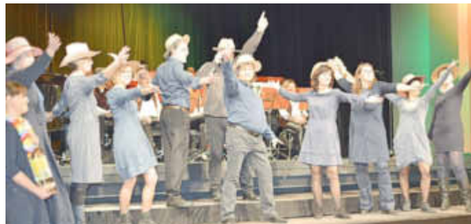
Chor Quodlibet