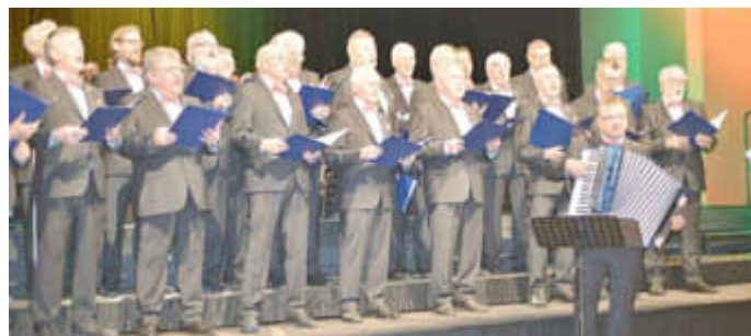
Männerchor Penzlin