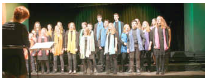
Klangfarben, Chor der Kreismusikschule Müritz