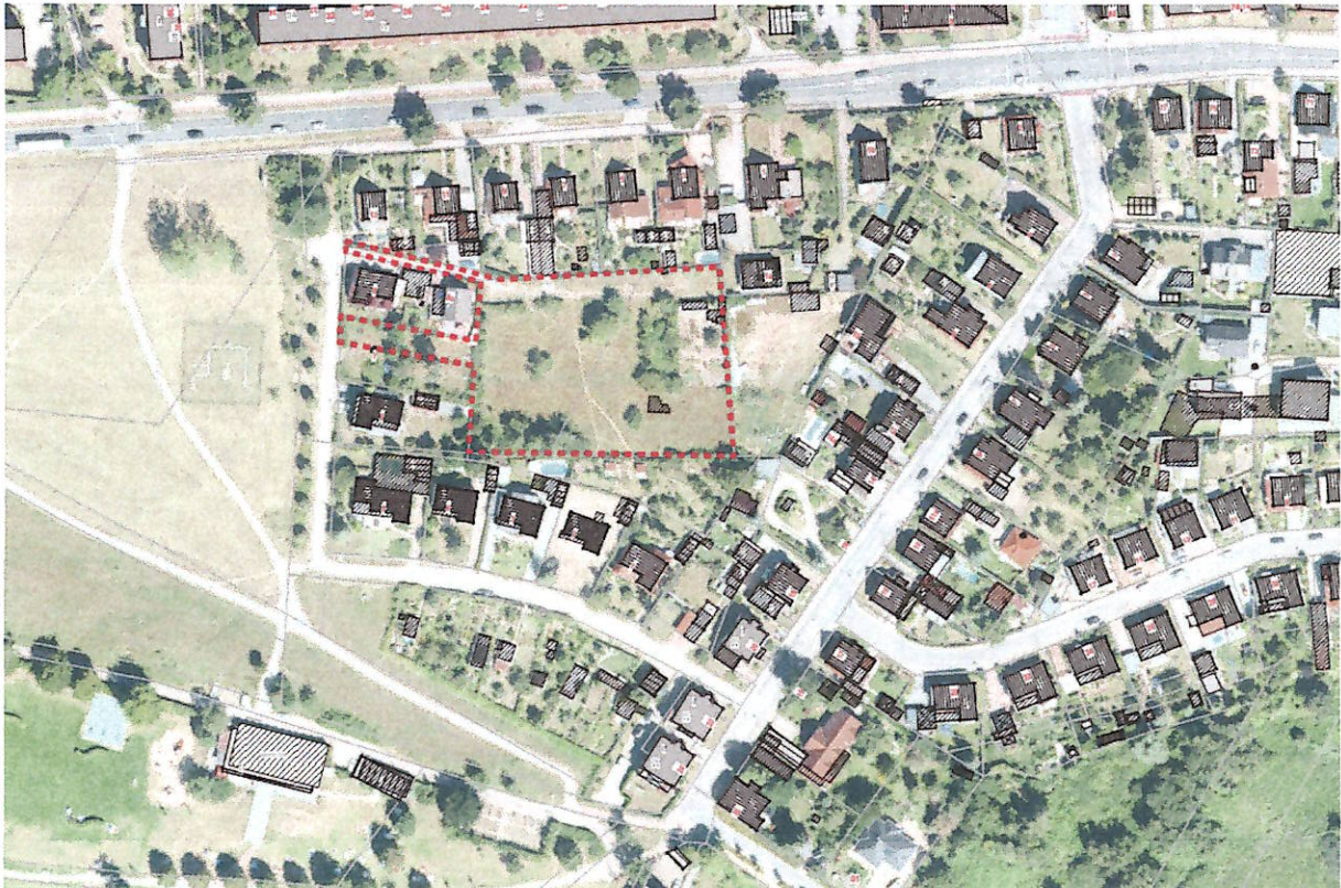
Abbildung 1: Lage des Plangebietes (Geltungsbereich rot) – ohne Maßstab

Der Geltungsbereich ist im anliegenden Lageplan (Anlage) gekennzeichnet. Der Lageplan ist Bestandteil der Satzung.